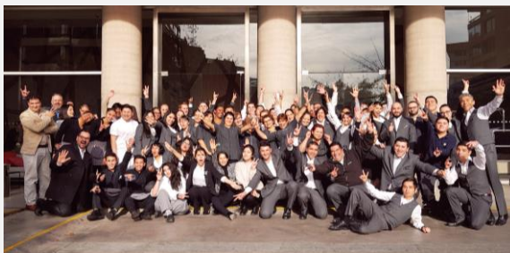
Pullman Santiago Vitacura | Pullman Santiago El Bosque