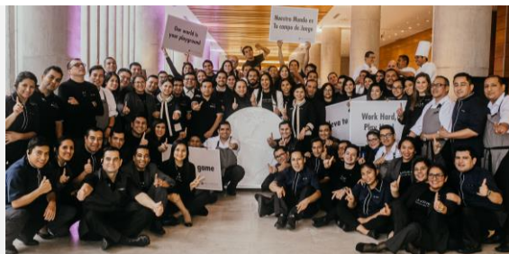
Pullman Lima San Isidro