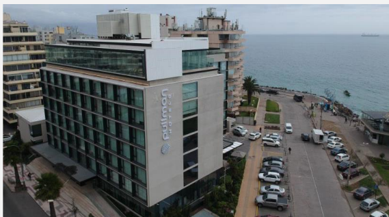
Pullman Viña del Mar San Martín