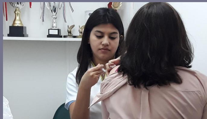
El Novotel Santiago Vitacura realizó una campaña de vacunación contra la Influenza. Todos los colaboradores fueron vacunados gratuitamente.