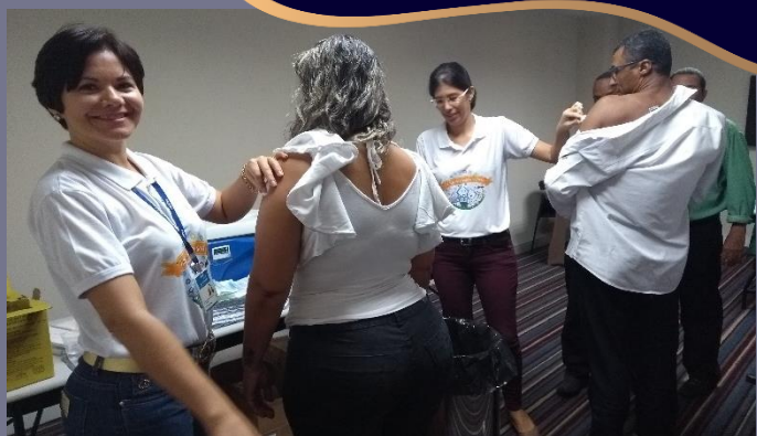
Allá en el combo Salvador Hangar Aeropuerto también hubo vacunación. En cooperación con el puesto de salud del barrio, ellos aplicaron más de 600 dosis de vacuna en los colaboradores y en sus familiares.