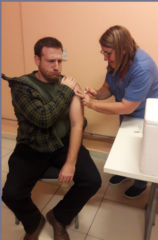
Los colaboradores del combo ibis Obelisco y Novotel Buenos Aires también fueron vacunados contra la gripe. ¡Todo el mundo protegido!