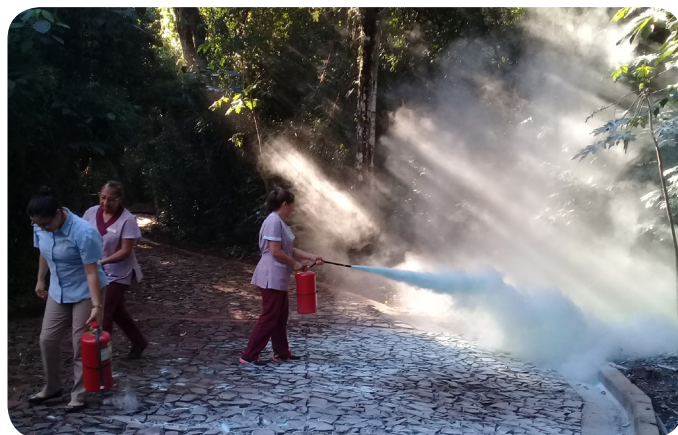
A equipe do Mercure Iru Iguazu participou de um treinamento de evacuação e uso de extintores de incêndio.