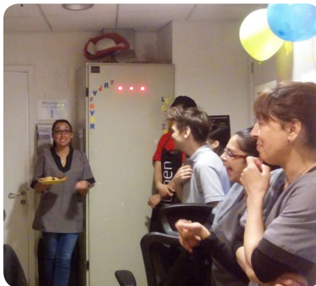
El equipo del ibis Valparaíso hizo una sorpresa para recibir a una de sus colegas en el trabajo. ¡Hubo hasta globos!