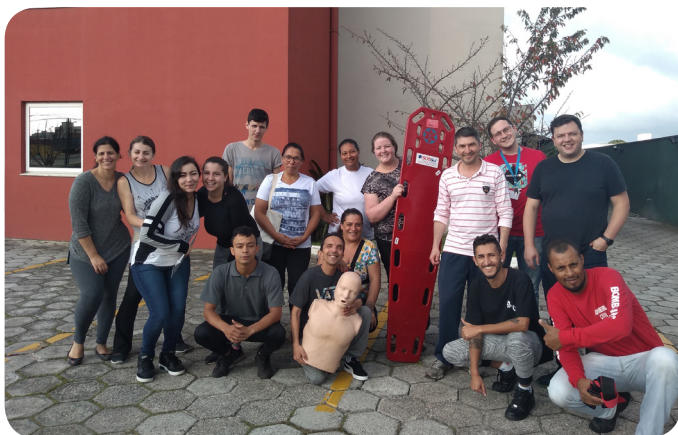
Los hoteles ibis Curitiba Aeroporto e ibis budget Curitiba Aeroporto hicieron el entrenamiento de brigada de incendio.