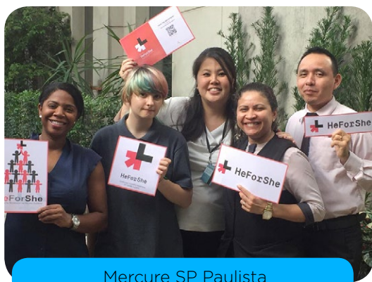
Mercure SP Paulista