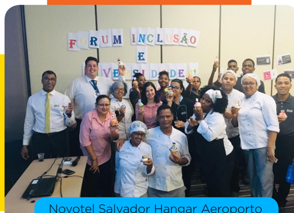
Novotel Salvador Hangar Aeroporto