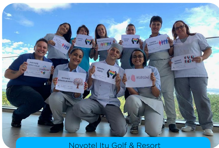
Novotel Itu Golf & Resort

Além disso, fizemos o lançamento do treinamento Inclusão como Chave do Sucesso . Destinado a todos os colaboradores, o treinamento on-line é fundamental para entendermos melhor as relações com pessoas com deficiência (PCDs), sejam colaboradores ou clientes. Ficou interessado? Então, anote na sua agenda, porque o treinamento estará disponível na plataforma Click Accor a partir de junho de 2019.