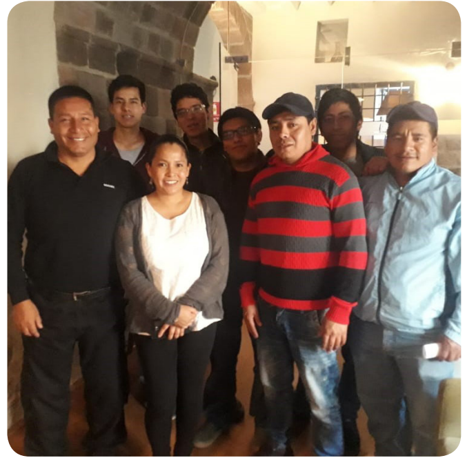
• Los colaboradores del Novotel Cusco participaron en una capacitación en seguridad alimentaria para mejorar cada día más el desempeño en el trabajo.