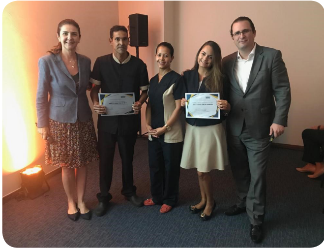
Los anfitriones del Mercure Brasília Eixo Monumental recibieron el premio Talent Star del año y del trimestre.