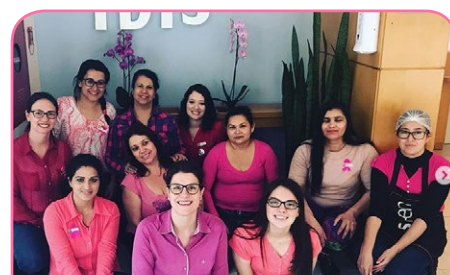
ibis Curitiba Batel