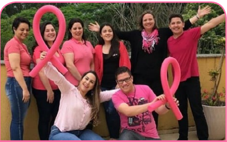
ibis Styles Curitiba Santa Felicidade