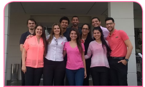
ibis São José