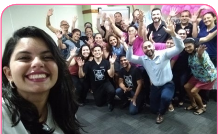
ibis Fortaleza Praia de Iracema