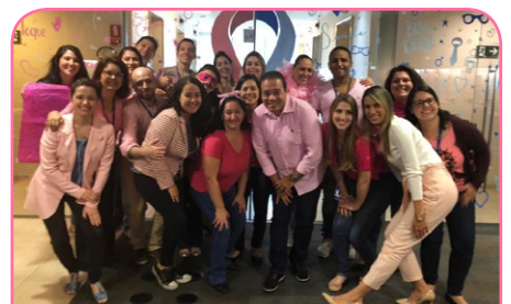
Sede São Paulo