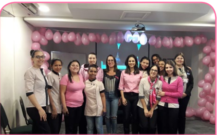
Mercure Florianópolis Convention