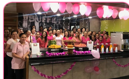
ibis budget SP Jardins