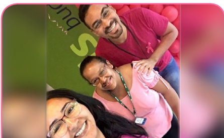
ibis budget Sertãozinho