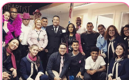
Pullman SP Guarulhos Airport