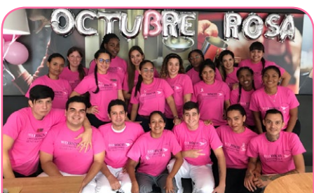
ibis Cali Granada