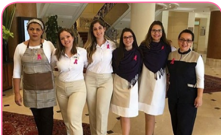
Grand Mercure SP Ibirapuera