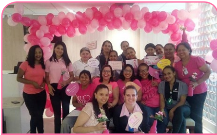
ibis Styles Goiânia