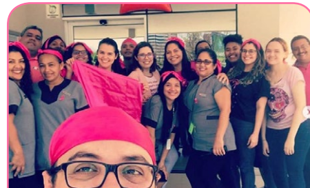
ibis Fortaleza Centro de Eventos