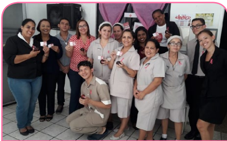
Mercure Fortaleza Meireles