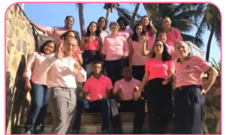
Mercure Salvador Rio Vermelho