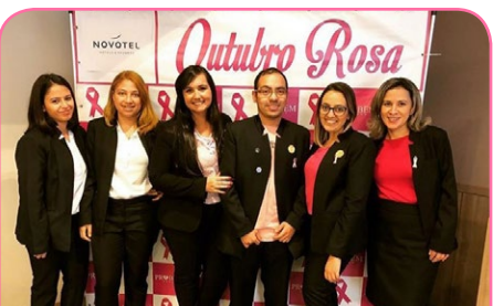
Novotel SP Berrini