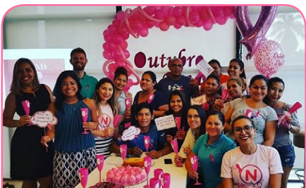
ibis budget Manaus