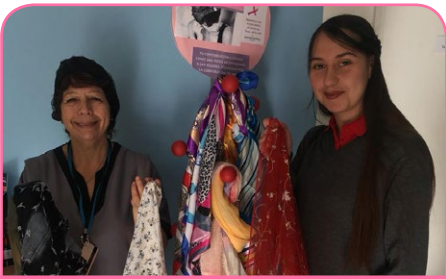
ibis Santiago Manquehue