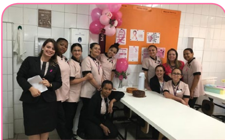
Mercure SP Paraíso