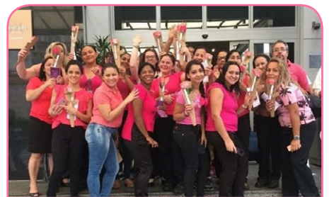
Mercure SP Paulista