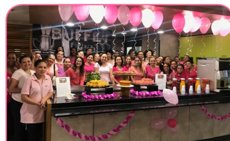
ibis budget SP Jardins