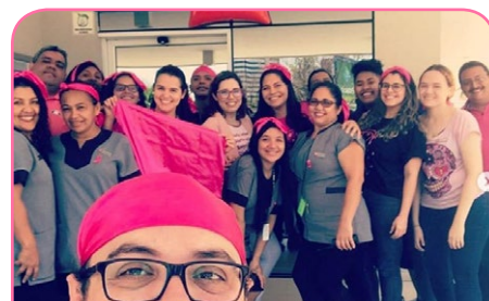
ibis Fortaleza Centro de Eventos