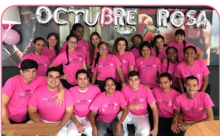
ibis Cali Granada