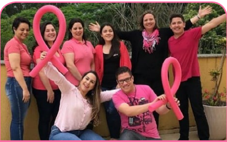
ibis Styles Curitiba Santa Felicidade