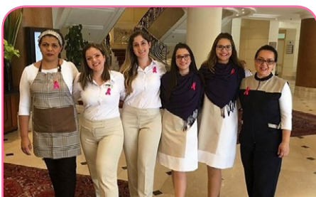
Grand Mercure SP Ibirapuera