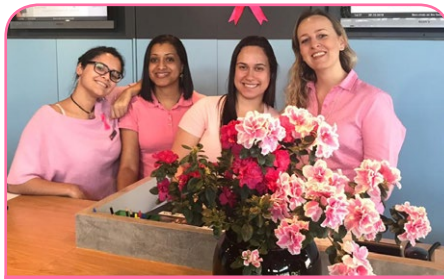
ibis Santo André