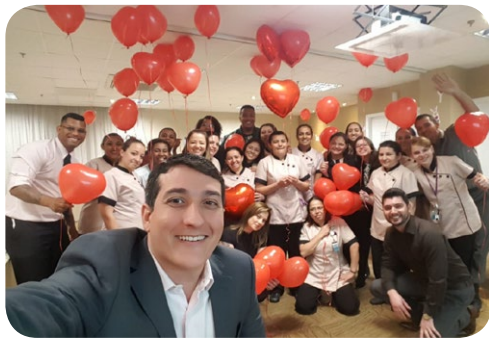
Mercure SP Vila Olímpia

Afinal, somos artistas que trabalham com o coração. Confira as unidades que treinaram suas equipes no último mês: