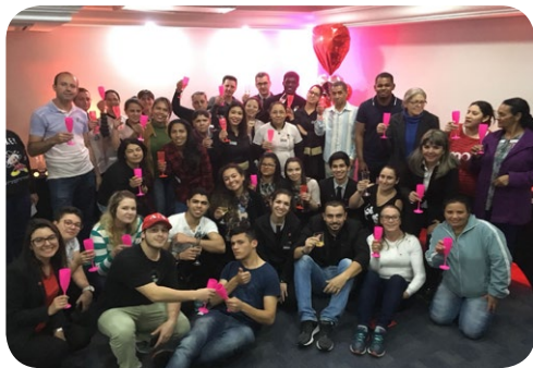
Mercure Curitiba Golden, Mercure Curitiba Batel, Mercure Curitiba Sete de Setembro e Mercure Curitiba Aeroporto