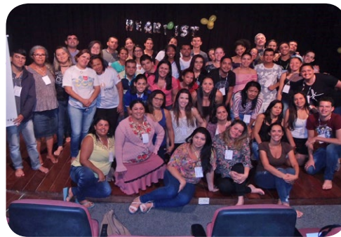
Mercure Maceió e ibis Maceió