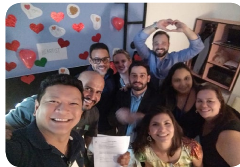
Mercure Goiânia e ibis Styles Goiânia