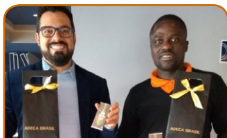
ibis budget Curitiba