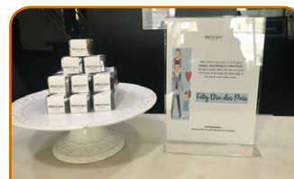
Mercure SP Ibirapuera Privilege