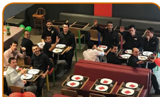
Combo Mercure e ibis Campinas