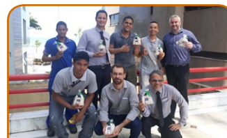
Mercure Recife Navegantes