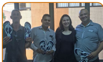
Mercure São Caetano do Sul