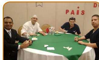
Grand Mercure SP Ibirapuera