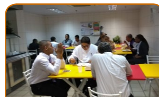
Novotel Salvador Hangar Aeroporto