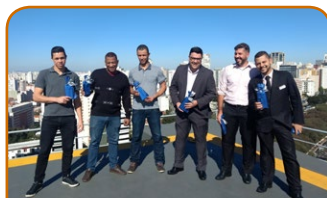
Mercure SP Bela Vista