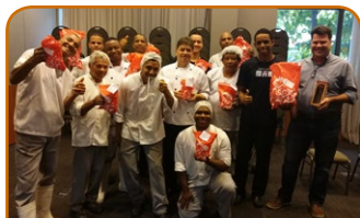
Combo ibis y Novotel RJ Santos Dumont