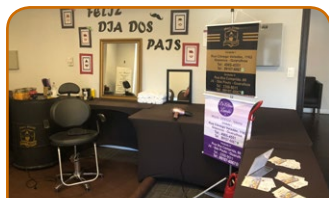
Mercure Guarulhos Aeroporto