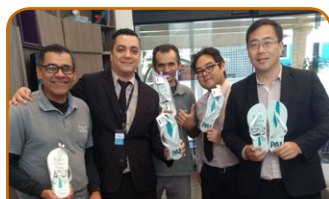
Mercure SP Moema