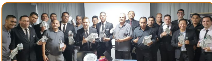
Mercure Brasília Líder