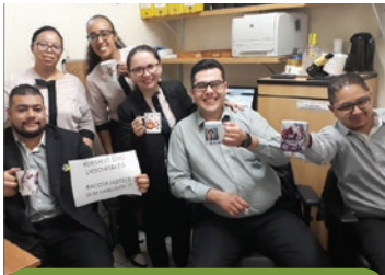
Adagio Aparthotel SP Moema

En las unidades de AccorHotels, los huéspedes y los equipos están dando adiós a las pajillas plásticas, comprometidos por la campaña interna de la empresa para eliminar el uso de pajillas en todos los hoteles. ¡Participe en esa acción! Publique en sus redes sociales, en modo público, fotos de las bebidas sin la pajilla y use hashtag #AccorHotelsSinPajilla.