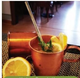
ibis Curitiba Batel