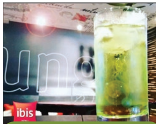
ibis Salvador Rio Vermelho