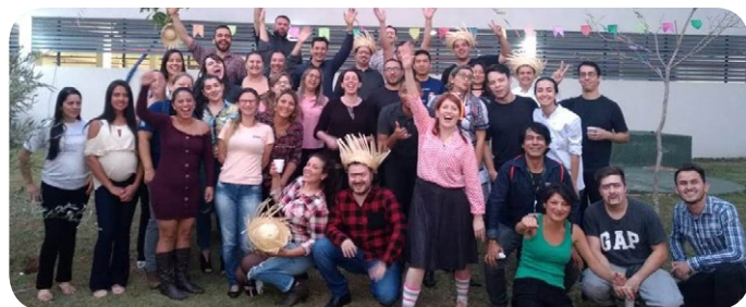
Novotel Sorocaba e ibis budget Sorocaba