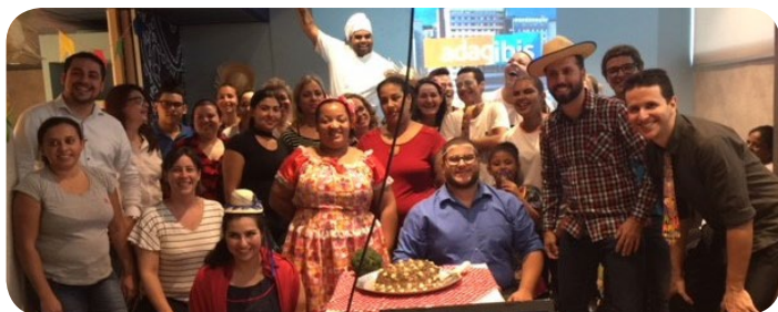
Combo Adagio Aparthotel Access Jundiaí e ibis budget Jundiaí

Os colaboradores não se cansam de comemorar os festejos típicos!