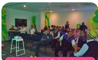
Novotel Salvador Hangar Aeroporto