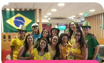
ibis RJ Nova América

La Copa del Mundo de Rusia está llegando al fin, pero los colaboradores de las unidades siguen en la hinchada por los finalistas.