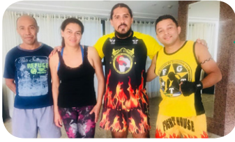
El equipo del Grand Mercure Brasília Eixo Monumental participó en una clase de muay thai.