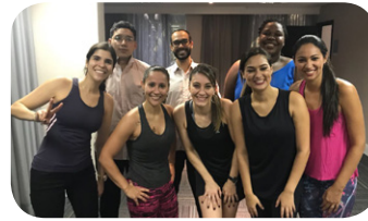
El equipo del Mercure SP Ginásio Ibirapuera participó en clase de zumba y en sesiones de masaje relajante.

Para conmemorar los dos años de VIVAH, el Sofitel Guarujá Jequitimar ofreció ensalada de frutas a los colaboradores, realizó gimnasia laboral y organizó una conferencia sobre autorresponsabilidad, con enfoque en salud.