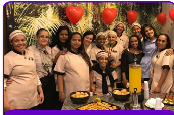
Mercure BH Vila da Serra