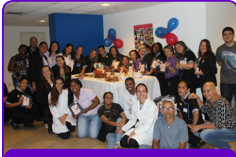
Novotel RJ Barra da Tijuca