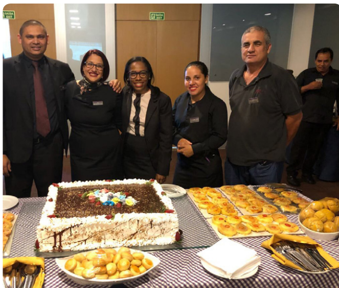
El Mercure Brasília Líder preparó una torta gigante para celebrar junto a los cumpleaños del mes.