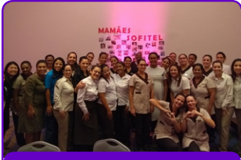
Sofitel Guarujá Jequitimar