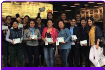
ibis Lima Larco Miraflores

Vea imágenes de momentos de la conmemoración del Día de la Madre en las unidades