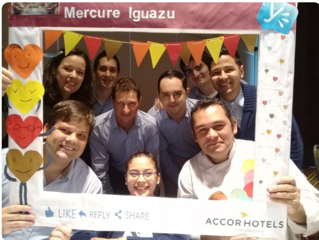
El equipo del Mercure Iguazu se reunió para conmemorar con los cumpleaños de abril.