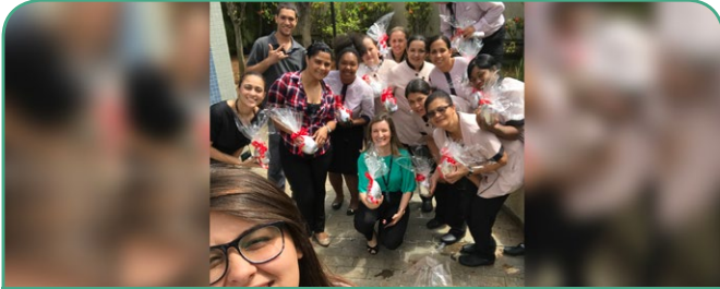
Mercure SP Moema