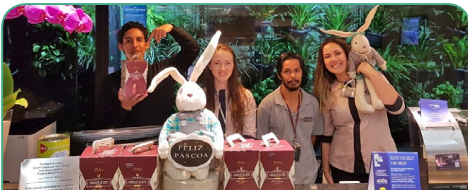
Mercure SP Pamplona