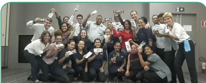
Novotel Salvador Hangar Aeroporto