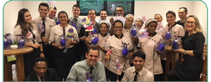
Mercure SP Nações Unidas