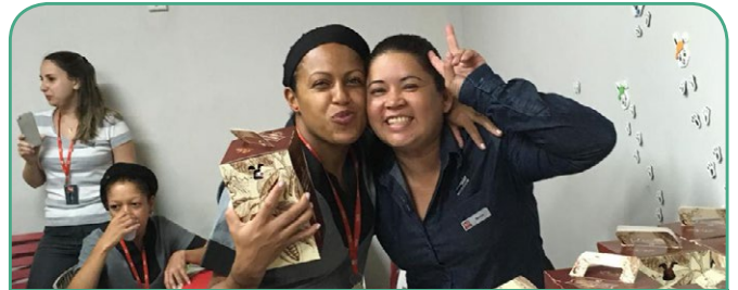
ibis SP Expo