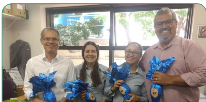
Hotel The Capital SP