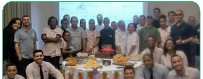
Mercure Botafogo Mourisco