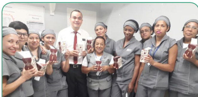
HOTEL Belas Artes managed by Accorhotels