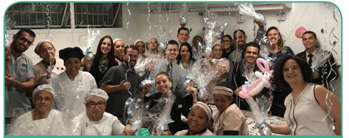
Mercure Santo André