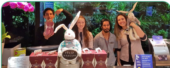
Mercure SP Pamplona