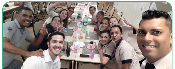
Mercure SP Vila Olimpia