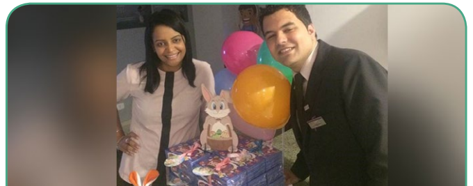
Mercure Curitiba Golden