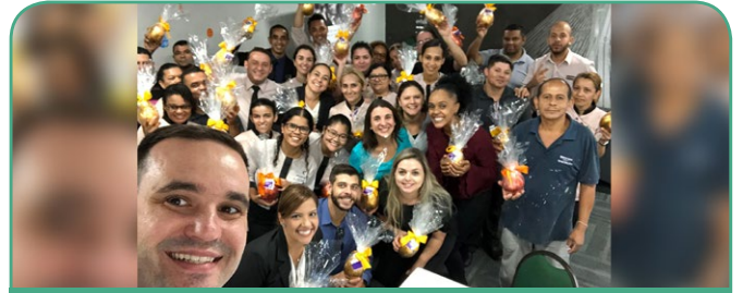
Mercure SP Ibirapuera Privilege