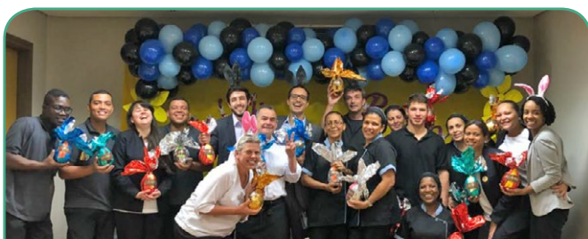
Novotel SP Jaraguá Conventions