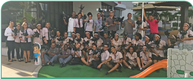
Mercure Salvador Boulevard