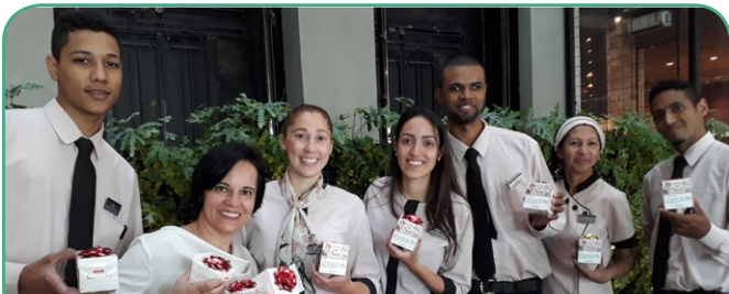
Mercure BH Vila da Serra