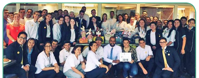
Novotel SP Morumbi