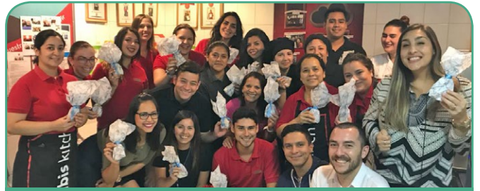
ibis Santiago Manquehue