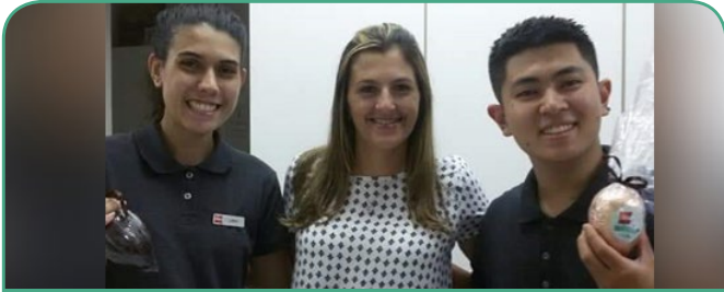
ibis São José