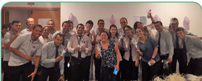
Mercure Florianópolis Convention