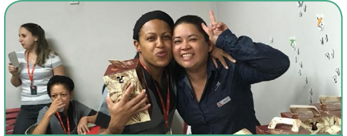
ibis SP Expo