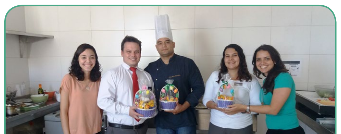
Mercure RJ Copacabana