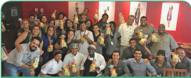
ibis RJ Centro