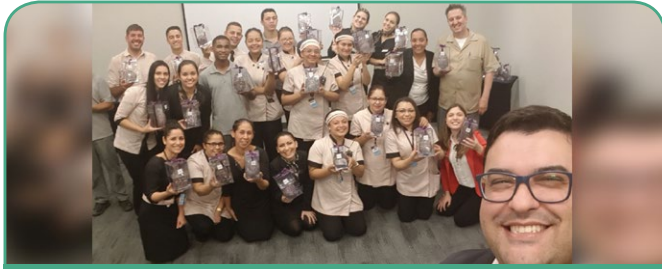
Mercure SP Bela Vista