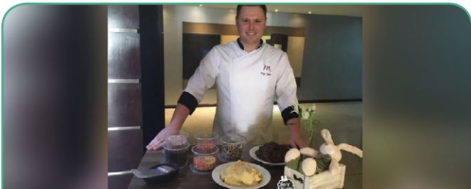
Mercure Curitiba Batel