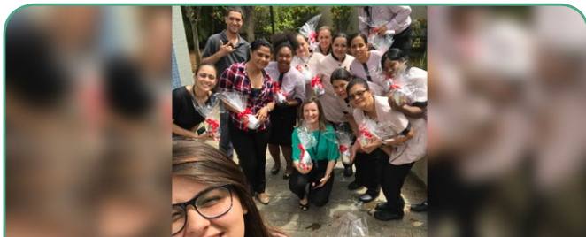
Mercure SP Moema