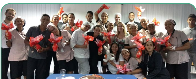
Mercure Recife Navegantes