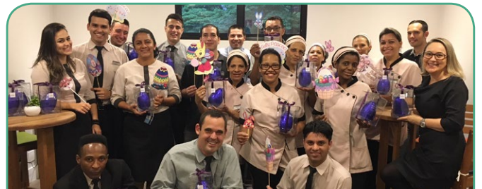
Mercure SP Nações Unidas