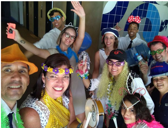
O bloco de Carnaval do Grand Mercure RJ Riocentro , o “BRT das 23:00”, animou a tarde dos hóspedes e colaboradores!