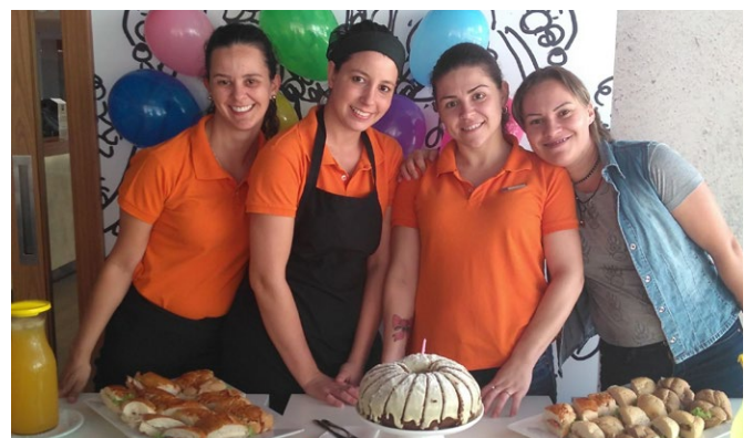
A comemoração dos aniversariantes do mês do ibis budget Não Me Toque foi repleta de alegria.