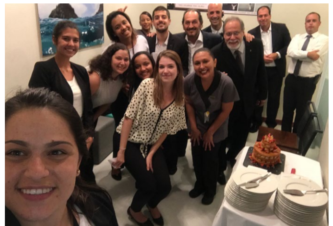
Os colaboradores do Sofitel RJ Ipanema festejaram os aniversariantes do mês com bolo e doces.