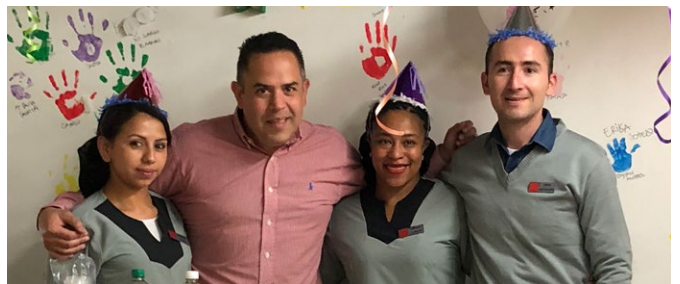
A equipe do ibis Bogotá Museo comemorou os aniversariantes de fevereiro com uma festa muito animada.