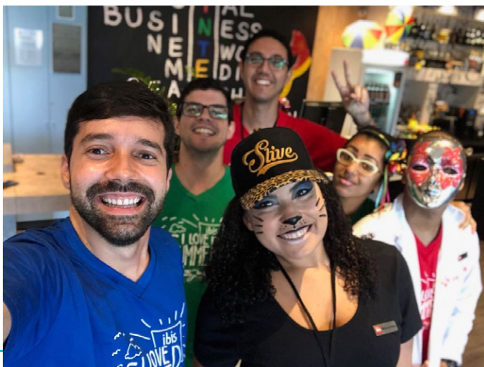
A equipe do ibis Recife Aeroporto entrou no clima da folia com os blocos “Tira Duvet põe Duvet” e “Levanta Para Tomar Café”. O hotel disponibilizou uma maquiadora como cortesia para os hóspedes, que também desfrutaram de música ao vivo.