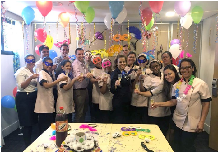
O Mercure SP Nações Unidas comemorou os resultados de 2017 da unidade com uma linda festa de Carnaval.