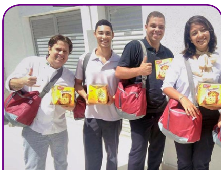
Novotel Barra da Tijuca