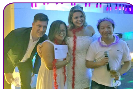
Mercure Brasília Líder