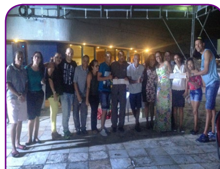
Novotel Salvador Rio Vermelho