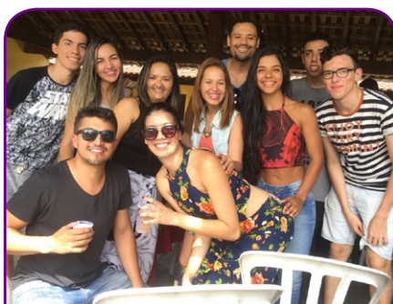
Novotel RJ Parque Olímpico