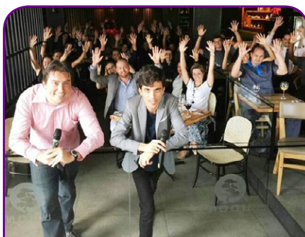
Caesar Business Belvedere