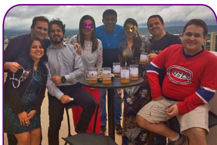
Grand Mercure Brasília Eixo Monumental