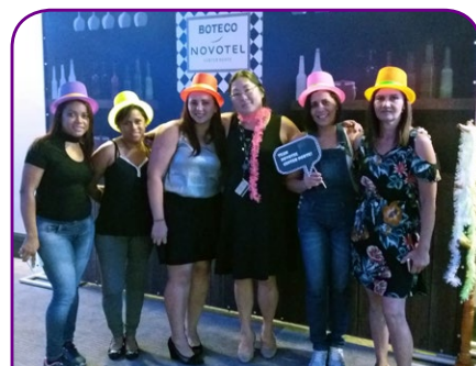
Novotel SP Center Norte