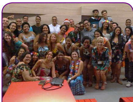
Adagio Aparthotel Salvador

A fines de 2017, los colaboradores celebraron las fechas conmemorativas con mucho estilo y animación en los hoteles. ¡Vea algunos momentos!