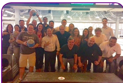
Clube de Sinergia Cerrado