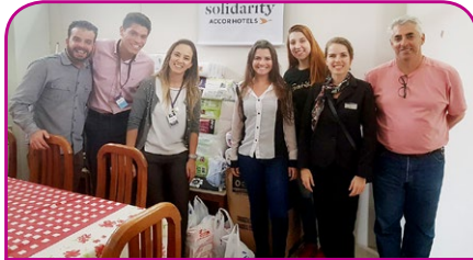
Clube de Sinergia La Belle Catarina