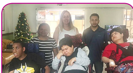
Novotel São José dos Campos