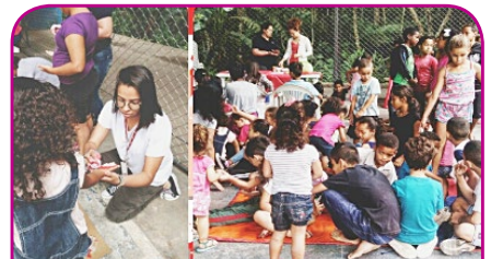
ibis SP Interlagos