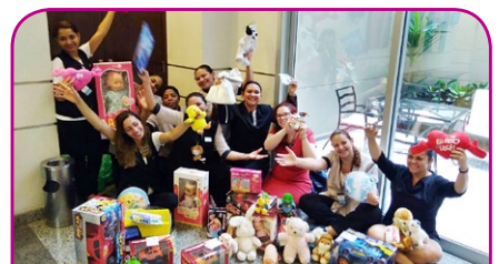
Mercure SP Paulista