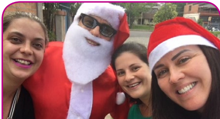
ibis Caxias do Sul