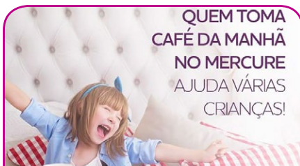
Mercure Santo André