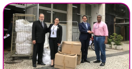
Sofitel RJ Ipanema