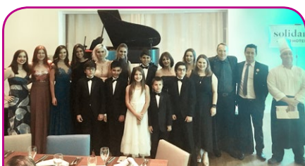
Novotel Porto Alegre