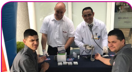
ibis Santo André