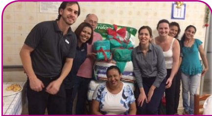
Combo ibis e Mercure Campinas

Diversas ações foram realizadas pelos colaboradores durante a Solidarity Week 2017. Confira alguns momentos!