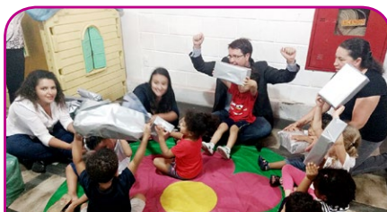
Mercure BH Lourdes