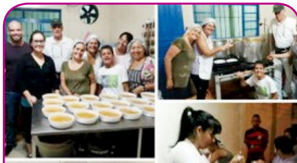
ibis SJ Curitiba