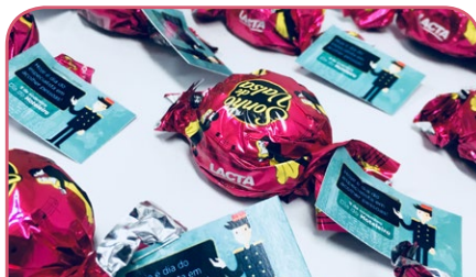
Mercure Salvador Boulevard

Para homenagear os nossos colaboradores, especialistas em acolher pessoas, as unidades reuniram as equipes em ações muito especiais!