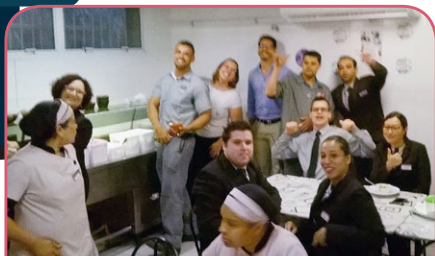
Mercure Santo André