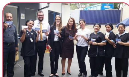
Novotel São José dos Campos