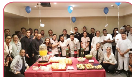
Mercure Botafogo Mourisco