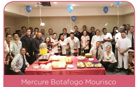
Mercure Botafogo Mourisco