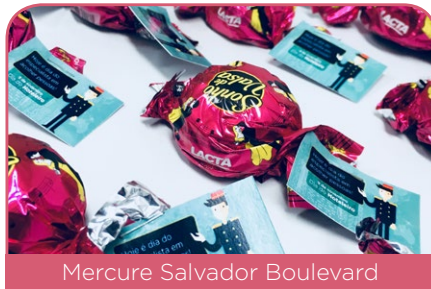
Mercure Salvador Boulevard

Para homenajear a nuestros colaboradores, especialistas en acoger personas, las unidades reunieron a los equipos en acciones muy especiales.