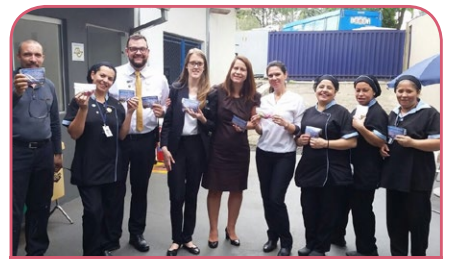
Novotel São José dos Campos