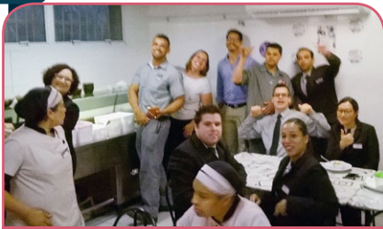
Mercure Santo André