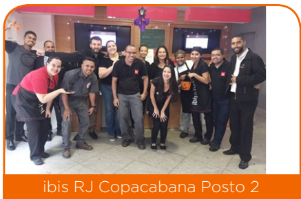
ibis RJ Copacabana Posto 2