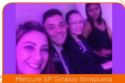
Mercure SP Ginásio Ibirapuera