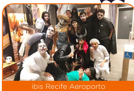
ibis Recife Aeroporto