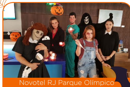
Novotel RJ Parque Olímpico