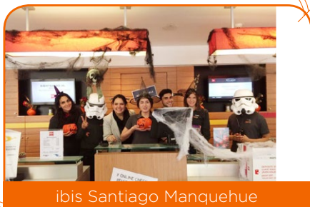
ibis Santiago Manquehue