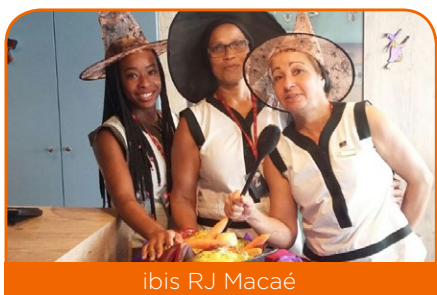
ibis RJ Macaé