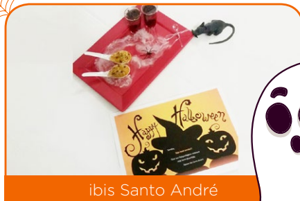
ibis Santo André