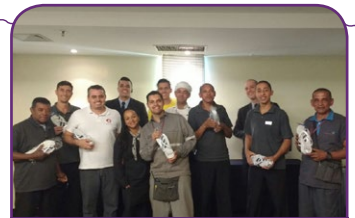
Caesar Business Belvedere

Para comemorar o dia dos pais, em agosto, as unidades presentearam os colaboradores que são pais com chinelos, porta-retratos, chocolates, toalhas e canecas personalizadas, kits de ferramentas, carregadores de celular, tardes de beleza, jogos, brincadeiras, churrascos e almoços. Não faltou carinho, respeito e admiração!