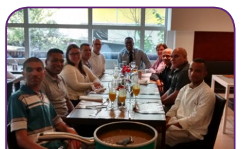
Mercure SP Jardins