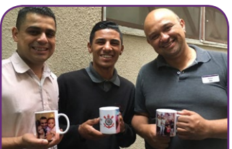
Mercure São Caetano do Sul