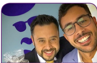
Novotel SP Jaraguá Conventions