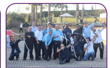
Pullman SP Guarulhos Airport