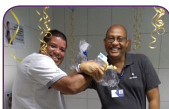
Novotel Salvador Hangar Aeroporto