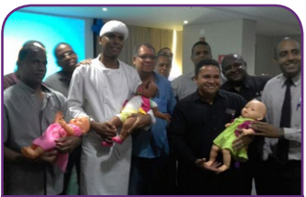
Mercure Salvador Pituba