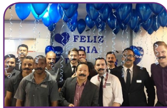
Mercure Brasília Líder