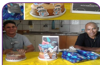
Mercure Fortaleza Meireles