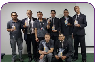
Mercure SP Pinheiros