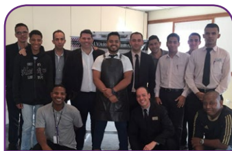
Mercure BH Lagoa dos Ingleses