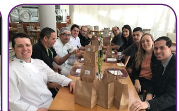
ibis e Mercure Santo André