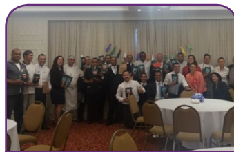
Grand Mercure SP Ibirapuera