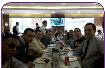
Mercure SP Nações Unidas