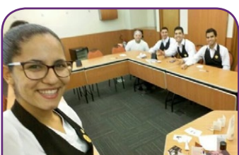
Novotel São José dos Campos