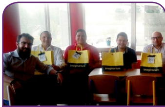
Combo ibis e ibis budget Tamboré