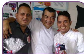
ibis Belém Aeroporto