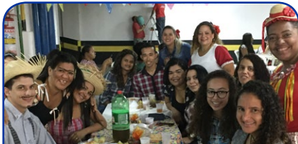
Clube de Sinergia Pocando ES

As festas juninas e julinas dos hotéis foram um sucesso e vão deixar saudades. Mas, no ano que vem, com certeza, terá mais!