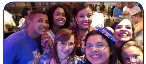
Grand Mercure RJ Riocentro