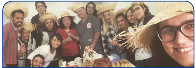
ibis Curitiba Centro Cívico