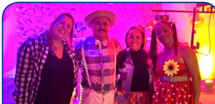
Combo Ibis e Mercure Guarulhos