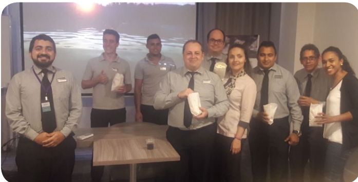
El equipo del Mercure Florinópolis Convention se reunió para ver la película "Extraordinario", promoviendo la reflexión de los colaboradores.