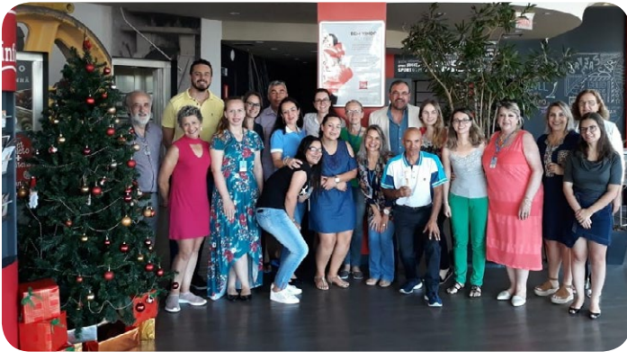
El ibis Caxias do Sul les brindó con un desayuno a los alumnos, padres y directores de Apadev (Asociación de Padres y Amigos de los Discapacitados Visuales).

Ve aquí las acciones realizadas por los hoteles el "Día D", para conmemorar el Día Internacional de las Personas con Discapacidades (el 3 de diciembre).