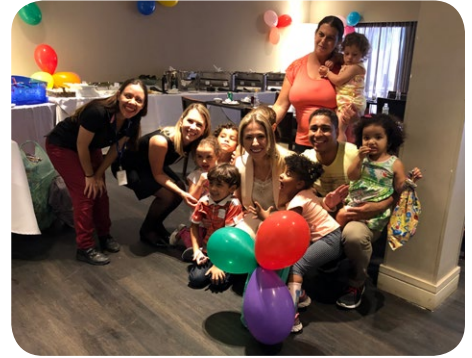
El Hotel Belas Artes SP Paulista managed by AccorHotels recibió con mucha alegría a los niños de una institución que atiende a niños carenciados o con necesidades médicas, que almorzaron en la unidad y participaron en varios juegos.