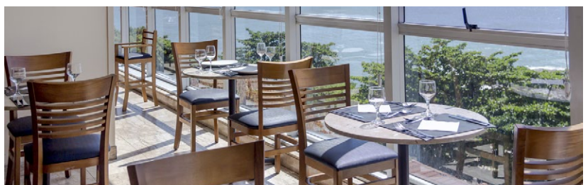
Novotel Salvador Rio Vermelho