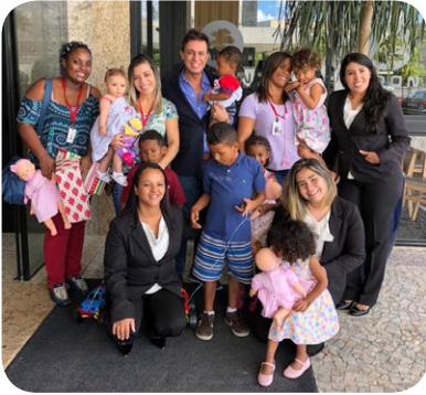
El Caesar Business Belvedere recibió a los niños de la Institución Irmão Sol para un almuerzo de confraternización.

Durante la semana solidaria de AccorHotels, las unidades se empeñaron en realizar el desafío del bien, visitando a ONG locales o abriendo sus puertas para recibir las instituciones.