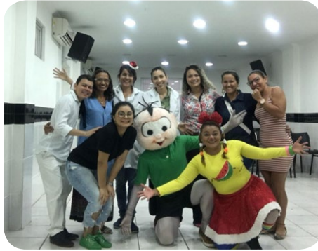
El equipo del ibis Belém Aeroporto realizó una acción con la APAE Belém, que atiende a personas con discapacidad intelectual y múltiples.