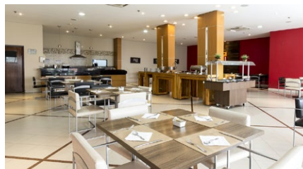
ibis Styles Cuiabá

A partir del 2 de enero, icinco unidades llegarán para sumarse a nuestro equipo en Brasil! Más unidades estarán a disposición de los clientes - y de los colaboradores - en tres grandes ciudades brasileñas: Salvador (Bahía), Belém (Pará) y Cuiabá (Mato Grosso). Novotel Salvador Rio Vermelho, Mercure Belém, ibis Styles Belém Nazaré, ibis Styles Belém Batista Campos e ibis Styles Cuiabá son los nuevos hoteles que tú, colaborador, podrás conocer, con descuentos especiales. Todos tendrán una tarifa fija para apartamentos single o doble, con desayuno incluido. El valor varía de R$90 (ibis Styles) a R$ 140 (Mercure y Novotel) + ISS. La tarifa especial estará disponible durante todo el año de 2019, en la página web de la Carte Bienvenue. ¡Haz tu reserva ya!